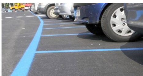
A pagamento linee blu, diventa parcheggio libero la sera