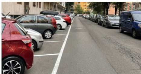
Libero: linee bianche